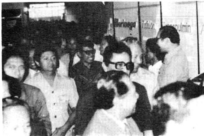
Peserta Simposium berbondong-bondong keruang pameran farmasi.