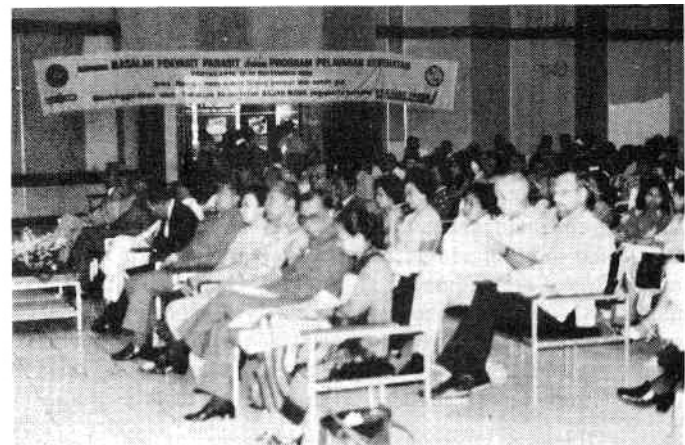
Suasana sidang Simposium