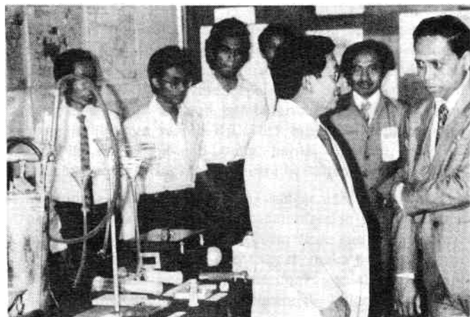
Menteri Kesehatan RI, Dirjen P3M dan Ketua Panitia Simposium berbincang-bincang dalam ruang pameran