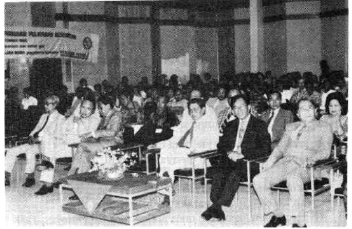
Peserta memenuhi ruangan Simposium, Gedung Pertemuan UGM, Yogyakarta.