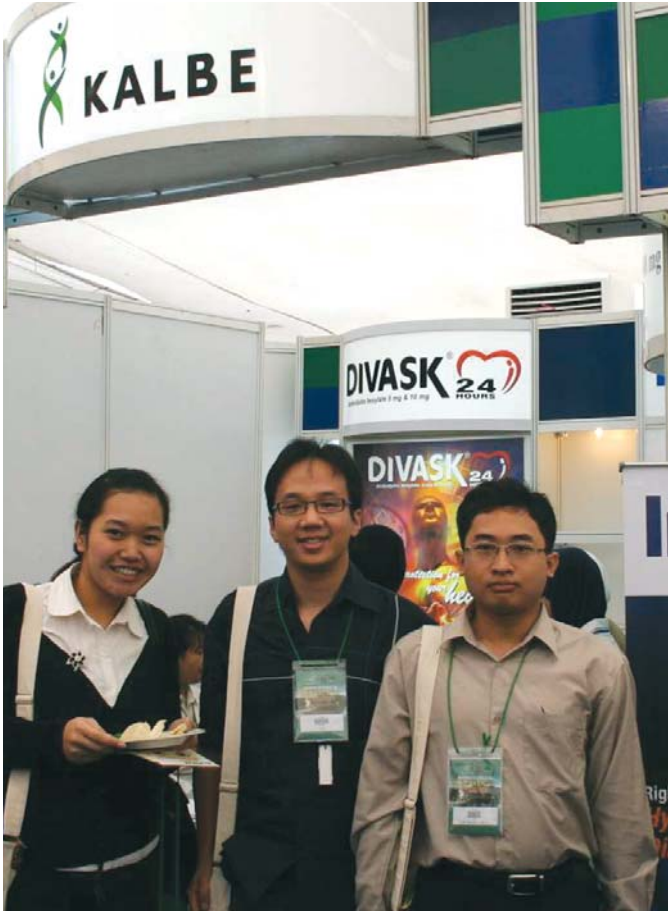
Kalbe berpartisipasi pada acara Kongres Nasional ke 7 PERSADIA dan KONKER PERKENI, KONKER PEDI di Hotel Agrowisata, Kota Baru, Malang tanggal 23-25 Oktober 2008.