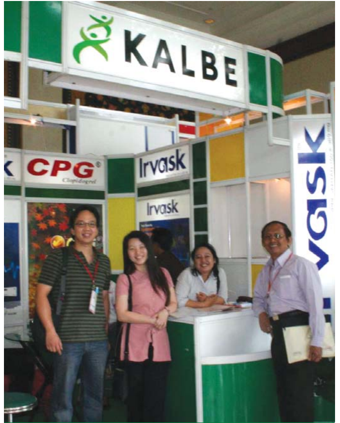
Kalbe turut serta dalam acara WECOC (Weekend Course on Cardiology) ke 20 di Hotel Gran Melia, Jakarta tanggal 7-9 November 2008. Seperti terlihat pada foto Tim Medical Support dan Marketing Discovery dalam stan Kalbe yang menampilkan produk CPG dan Irvask.