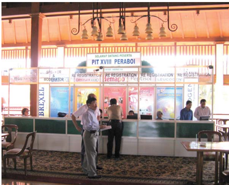
Tempat pendaftaran PIT XVIII PERABOI di Hotel Lor In Solo, Jawa Tengah, tanggal 30 Oktober - 1 November 2008. Tim Marketing Explorer Kalbe turut serta dalam acara tersebut dengan menampilkan produk Brexel dan Hemapo.