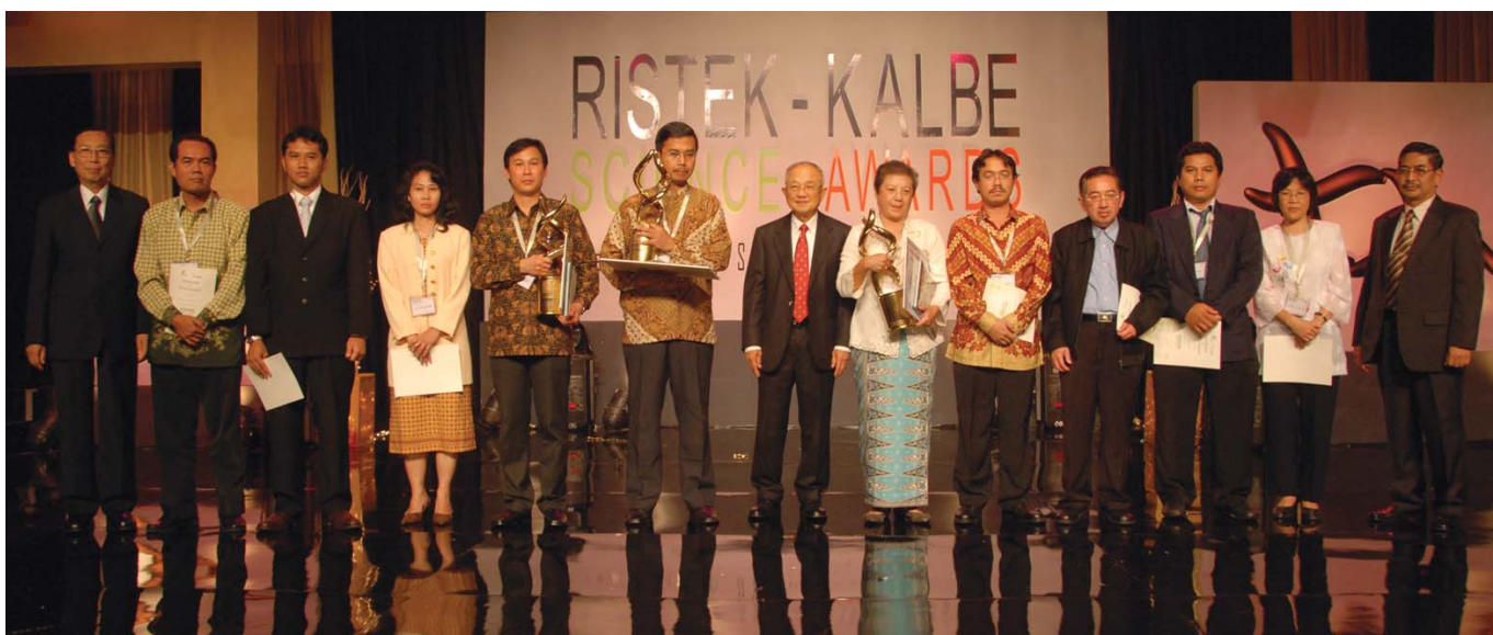
Penganugerahan 'Ristek Kalbe Science Awards 2008' untuk pemenang kategori 'Best Research'.