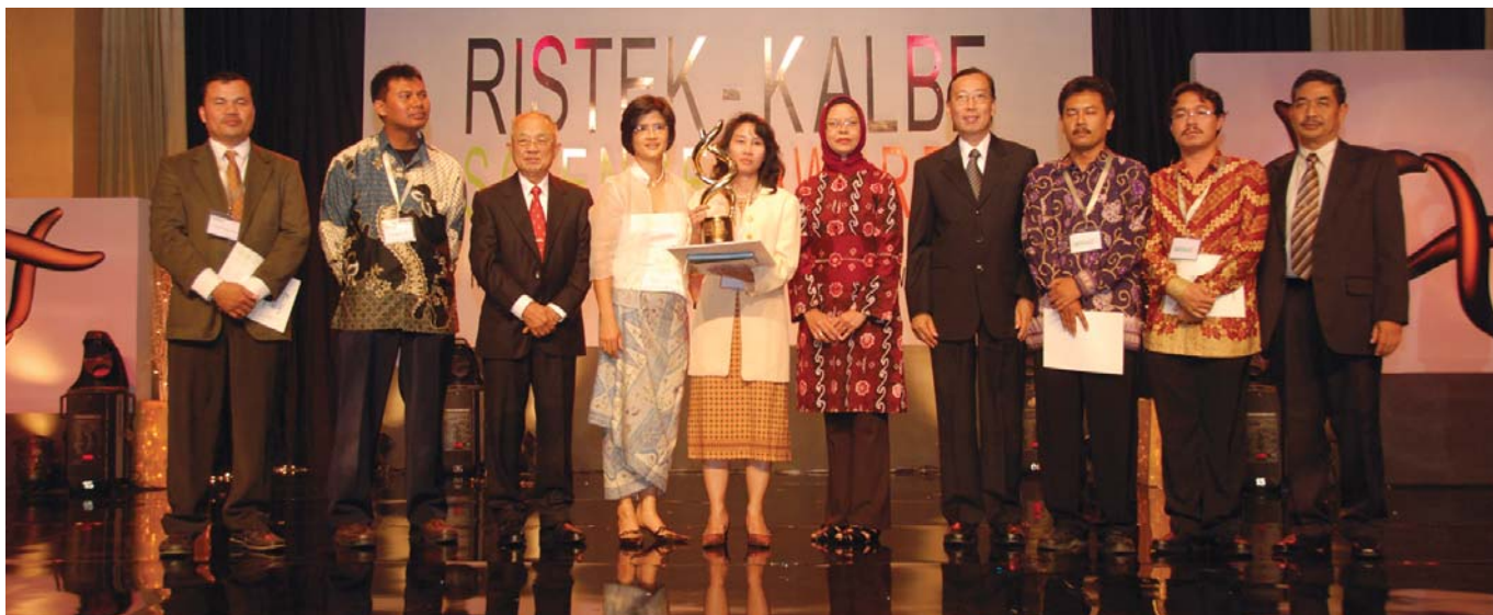
Penganugerahan 'Ristek Kalbe Science Awards 2008' untuk pemenang kategori 'Young Scientist'.