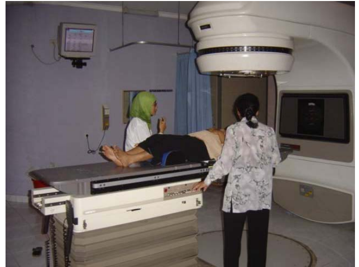
Gambar 2. Alat Radiasi Eksterna (Linear Accelerator)