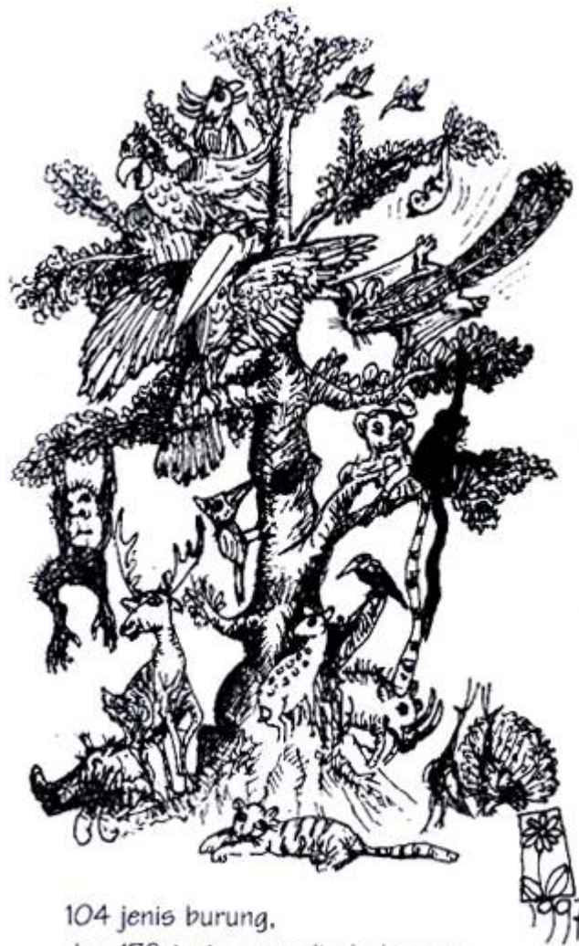
104 jenis burung, dan 178 jenis mamalia Indonesia terancam musnah !